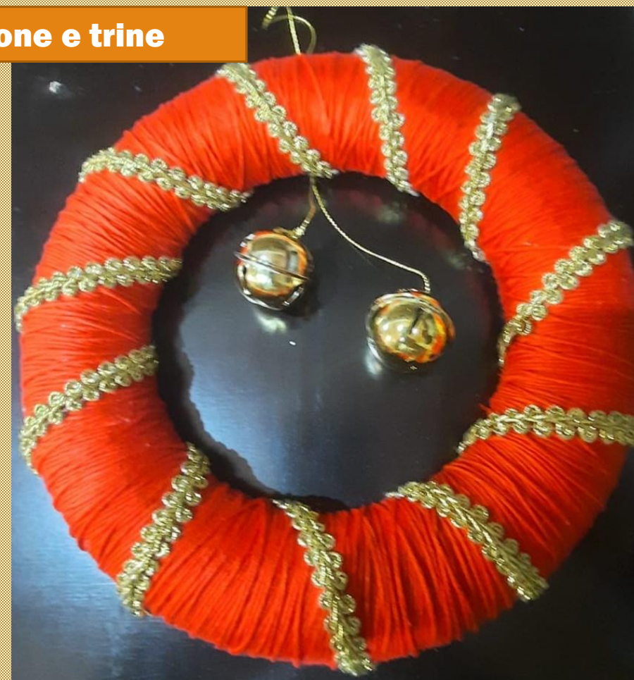
Cotone e trine